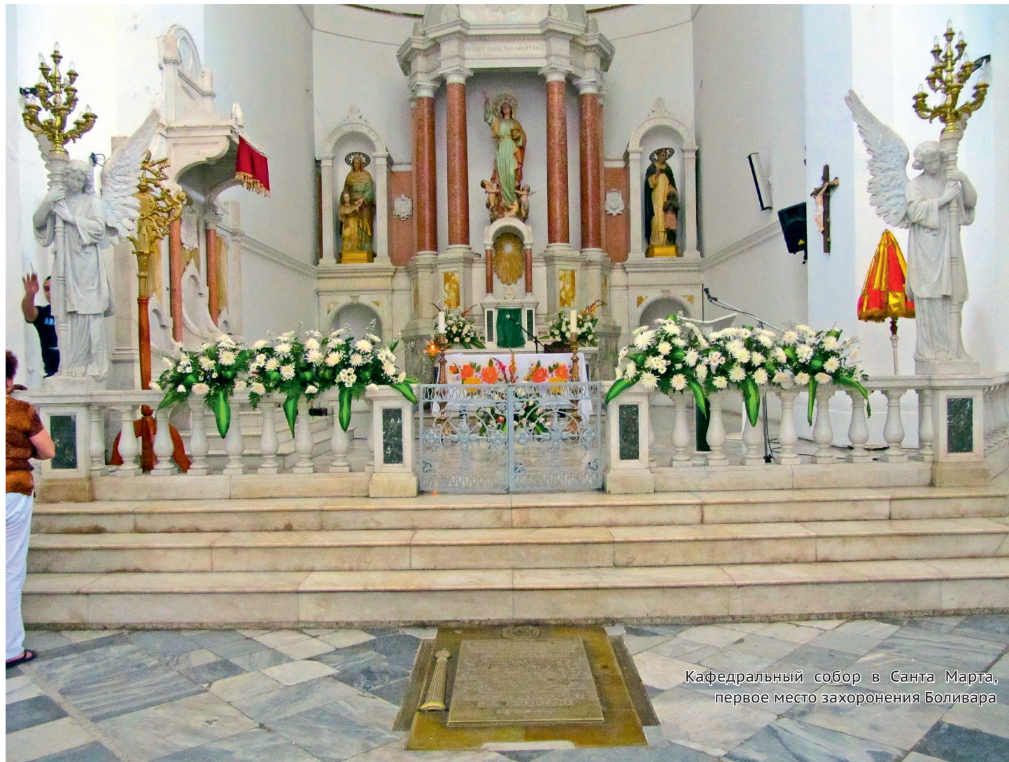
Кафедральный собор в Санта Марта, первое место захоронения Боливар

17 декабря 1830 г. великий Боливар скончался в городке Санта Марта на севере Колумбии в поместье Сан-Педро-Александрино. Он прожил всего 47 лет. В своем завещании он просил похоронить его в родной Венесуэле, в любимом Каракасе, но его захоронили в Санта-Марта. Узнав о смерти Боливара, Мануэла попыталась покончить с собой, но её спасли. Ей предстояло прожить ещё четверть века и подвергаться злым преследованиям. После смерти Боливара Мануэла была выслана из Боготы. Она уехала на Ямайку, затем возвратилась в Эквадор, но оттуда тоже была выслана. Прodelав долгий путь по странам Латинской Америки, в 1834 г. Мануэла нашла пристанище в Пайте, маленьком перуанском городке на берегу Тихого океана.