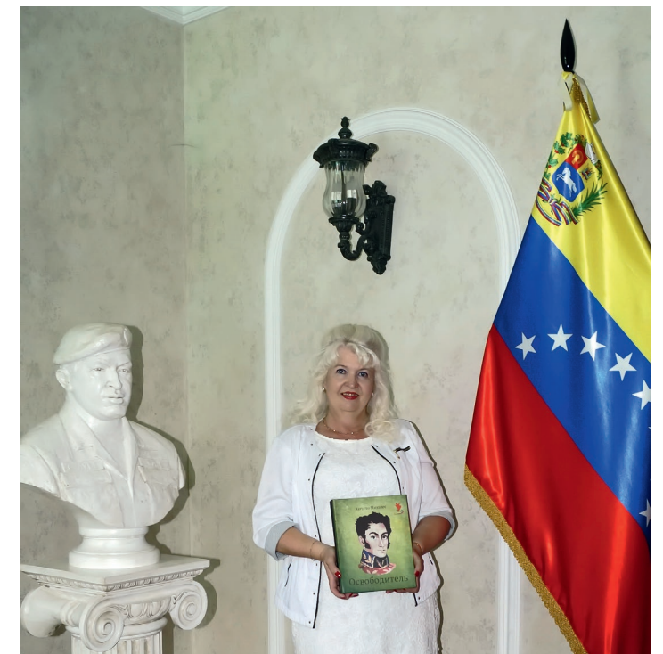
В Посольстве Боливарианской Республики Венесуэлы в Российской Федерации